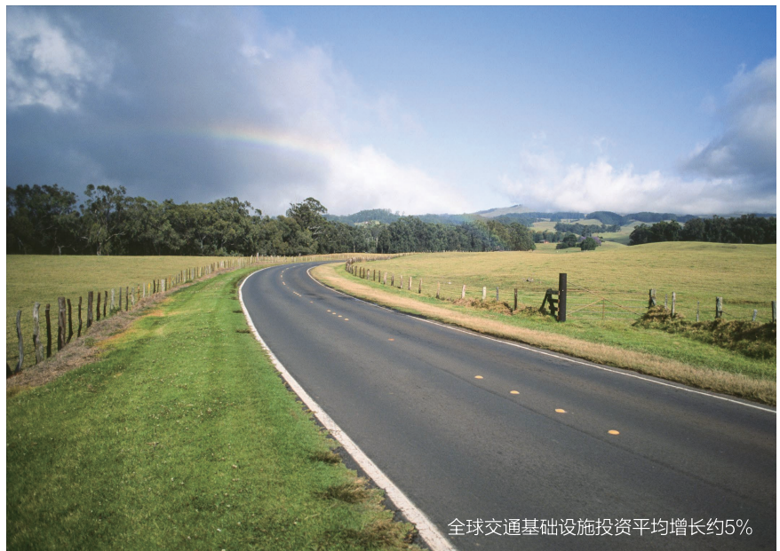
全球交通基础设施投资平均增长约5%

城市是探索旅游与现代生活融合模式的范例地 旅游成为城市有机更新、城市经济复兴的主要依托。城市成为旅居共享，跨文化交流的重要承载地。城市与旅游的交互是健康和谐与可持续发展的现代生活方式的最佳呈现。